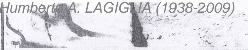
"PLANO FORTIN DE SAN RAFAEL DEL DIAMANTE"