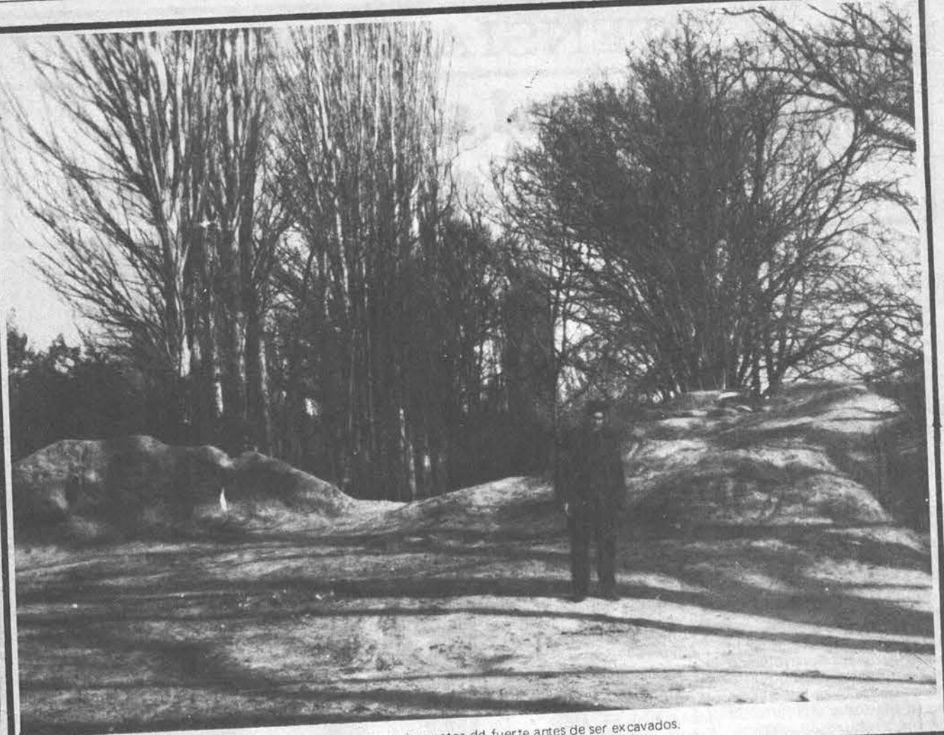
Vista parcial de los restos del fuerte antes de ser excavados.

de a un plano de terraza que brindó todas las necesidades para la protección de la frontera, para el regadío y la construcción de viviendas de los primeros colonos.