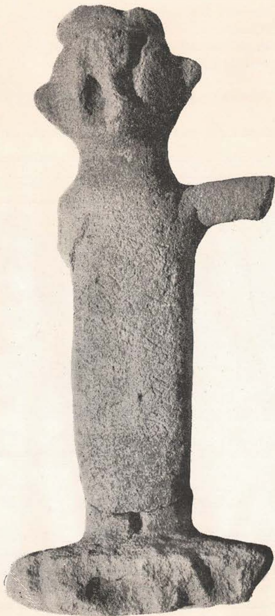
FIG. 1. - Vista fotográfica de la estatuita indígena procedente de Agua Escondida, Malal-hue (Mza.), \frac{1}{2} de su Tam. Nat. (Foto Mus. S. Raf., Documentación Fotográfica José A. Vrana).