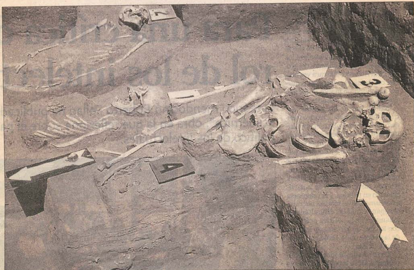
Enterratorio del Rincón del Atuel.

La exploración arqueológica ha permitido reconstruir hábitos y ceremonias de los primigenios habitantes de la región en torno a la muerte.