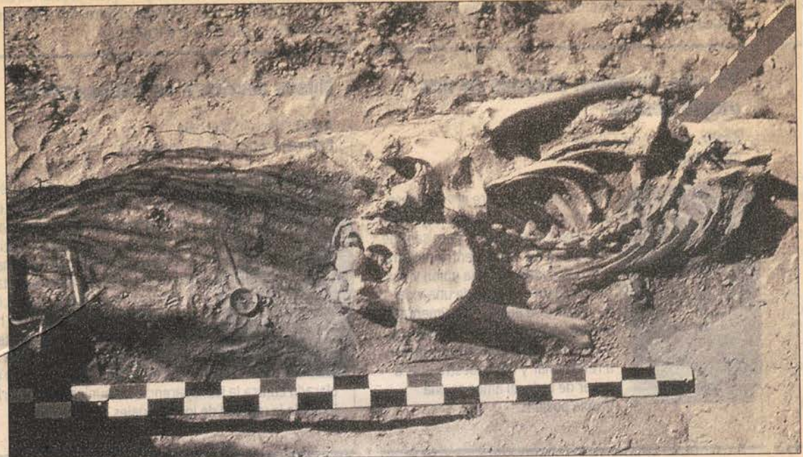
Enterratorio de Valle Grande.

En la zona de Los Buitres, al oeste de San Rafael, se produjo un interesante hallazgo de un enterramiento de un cazador-recolector, fechado en el 1000 de la Era Cristiana, el que apareció en los faldeos de un médano. El hallazgo pudo realizarse mediante la intervención del autor y proceder a extraerlo en la misma posición que fue inhumado.